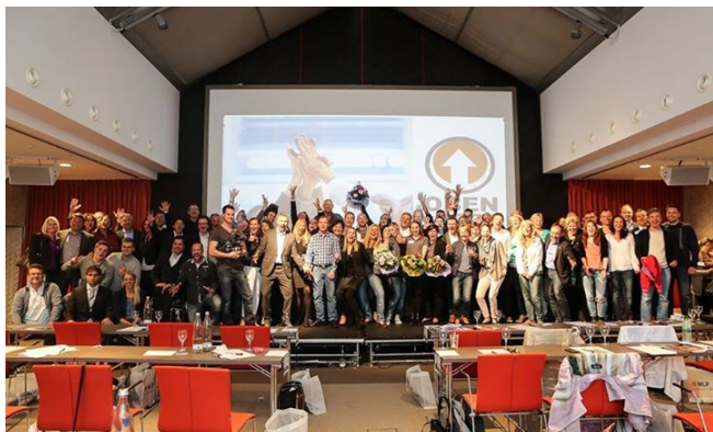
Oben ist besser 2015–Abschlussbild Teilnehmer und Referenten

Hierfür sind im Wesentlichen zwei Faktoren verantwortlich. Zum einen die Referenten. Die Mischung zwischen anerkannten Experten und jungen, aufstrebenden Rednern (die alle über langjährige Trainer